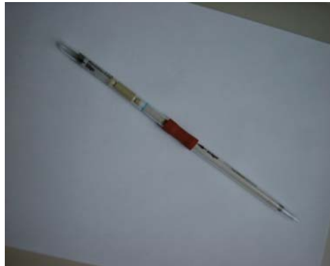
Messröhrchen und Aktivierungsröhrchen

Messröhrchen und Aktivierungsröhrchen mit dem beiliegenden orangefarbenen Gummischlauch verbinden.