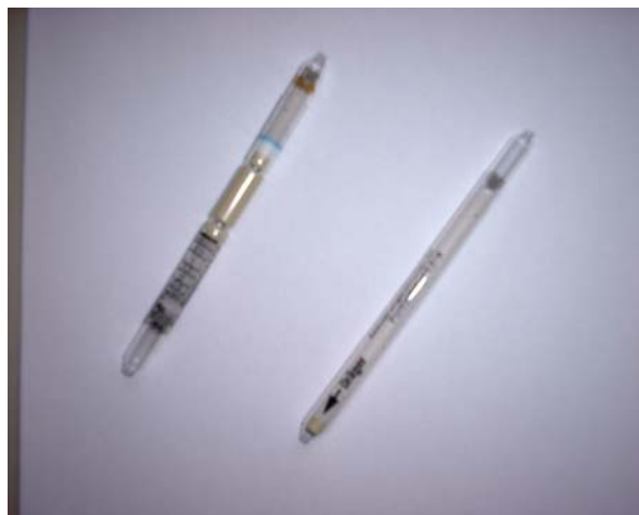
Messröhrchen und Aktivierungsröhrchen