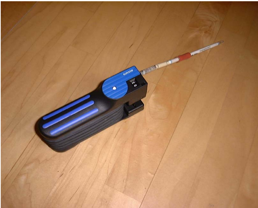
Pumpe mit Messröhrchenset

Messröhrchen und Aktivierungsröhrchen nach dem Verbinden in die Handpumpe einstecken. Dabei wird das Formaldehyd Messröhrchen in die Pumpe gesteckt.