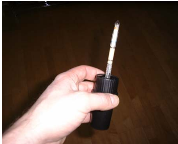
Röhrchen-Öffner mit Röhrchen

Messröhrchen und Aktivierungsröhrchen an beiden Enden mit Röhrchen-Öffner öffnen. Dazu Röhrchen bis zu Anschlag in die mittlere Bohrung des mit Röhrchen-Öffners stecken, 1 bis 2 mal drehen. Dadurch wird das Glas angeritzt. Danach die geritzte Spitze in die äußere Bohrung stoßen. Dadurch bricht die Glasspitze ab und fällt in den Behälter.