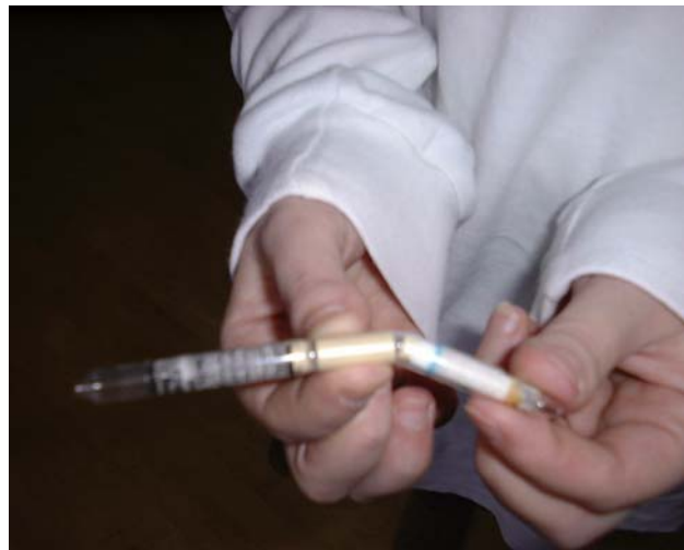
Linkes und rechtes Formaldehydröhrchen öffnen

Das Formaldehydröhrchen besteht aus zwei verschlossenen Einzelröhrchen die über einen Keramikring und eine Plastikummhüllung verbunden sind. Das Röhrchen in der Mitte am beigefarbenen Keramikring festhalten und links und rechts zur Öffnung der im Keramikring befindlichen verschlossenen Röhrchenenden knicken.