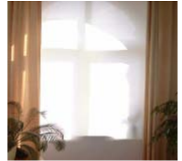
abschirmender Gardinenstoff (blickdicht) - Baumwolle

Bei diesem Schlafzimmer (Bild links) konnten wir vor der Anbringung des Vorhanges eine Feldstärke von bis zu 30 µW/qm im Bettbereich messen. Ursache war ein E-Netz Sendeturm in der Nähe. Nach Anbringung des Vorhangstoffes liegen die Messwerte bei max. 0,4 µW/qm. Bei diesem Stoff handelt es sich um einen nicht blickdichten Abschirmstoff. Dieser Stoff ist auch als Strahlenschutz (zugleich Mückenschutz) im maßgefertigten Alurahmen lieferbar. Weiteres Anwendungsbeispiel des weißen Abschirmtextils vor einem Fenster mit zusätzlichem gelbfarbenem Vorhang (Bild rechts). Wir stellen weiterhin verschiedene Bettbaldachine (auch Sonderanfertigungen-Kastenform) sowie T-Shirts, Tops und abschirmende Rollos her. News dazu finden immer Sie auf unseren Internetseiten.