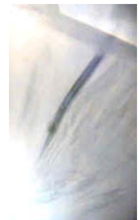
Metallfaser im Abschirmtextil Aufnahme 1:400 Trevira