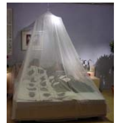
Baldachin 2 x 2 m und größer