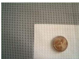
Blickdurchlässiger Stoff (Trevira)