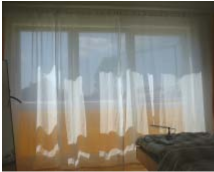
abschirmender Gardinenstoff (nicht blickdicht) - Trevira

Zur Verwendung als Baldachin oder als Vorhang kann der Stoff zusammengenäht werden. Eine Erdung braucht zur Abschirmung gegen hochfrequente Felder nicht vorgenommen werden. Eine Erdung kann zur Ableitung elektrostatischer Felder bei Baldachinen vorgenommen werden. Bitte beachten Sie, dass dieses Material normal gewaschen werden kann, ohne die abschirmende Eigenschaft zu beeinflussen. Berücksichtigen Sie unbedingt unsere Pflegehinweise. Wir dürfen versichern, dass Sie den blickdichten Stoff nicht von einem regulären Baumwollgewebe unterscheiden können.