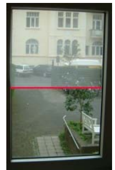
NEU Bett-Baldachine ab EUR 429,90 blickdurchlässiger Stoff (oben)

Zum Vergleich von zwei stark unterschiedlichen Zahlenwerten verwendet man oft logarithmische Darstellungen in Dezibel (dB). Um eine Verminderung der Feldstärke um den Faktor 10 im obigen Beispiel zu erreichen benötigen Sie ein EMV-Abschirmsystem mit der Dämpfung 20 dB (für den jeweiligen Frequenzbereich).