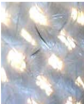
Metallfaser im Abschirmtextil Aufnahme 1:100