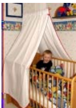
Betthimmel für Kinderbetten

Ingenieurbüro Oetzel Motzstr. 4 34117 Kassel Tel.: 0561 / 26569 Fax: 0561 / 2889586