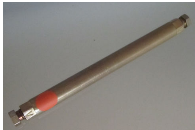
Thermodesorptions-Röhrchen zur MVOC-Messung