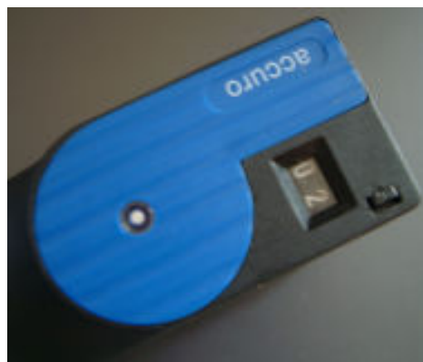
Oberseite Probenahmepumpe mit Sichtfenster und Zählwerk